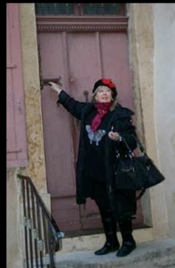
Une lettre à Catherine Camus sur mon périple avec la caravane Catalane Perpignan en Algérie hommage à l'Ecrivain