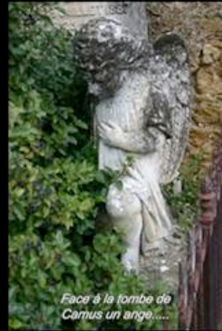
Face à la tombe de Camus un ange.....